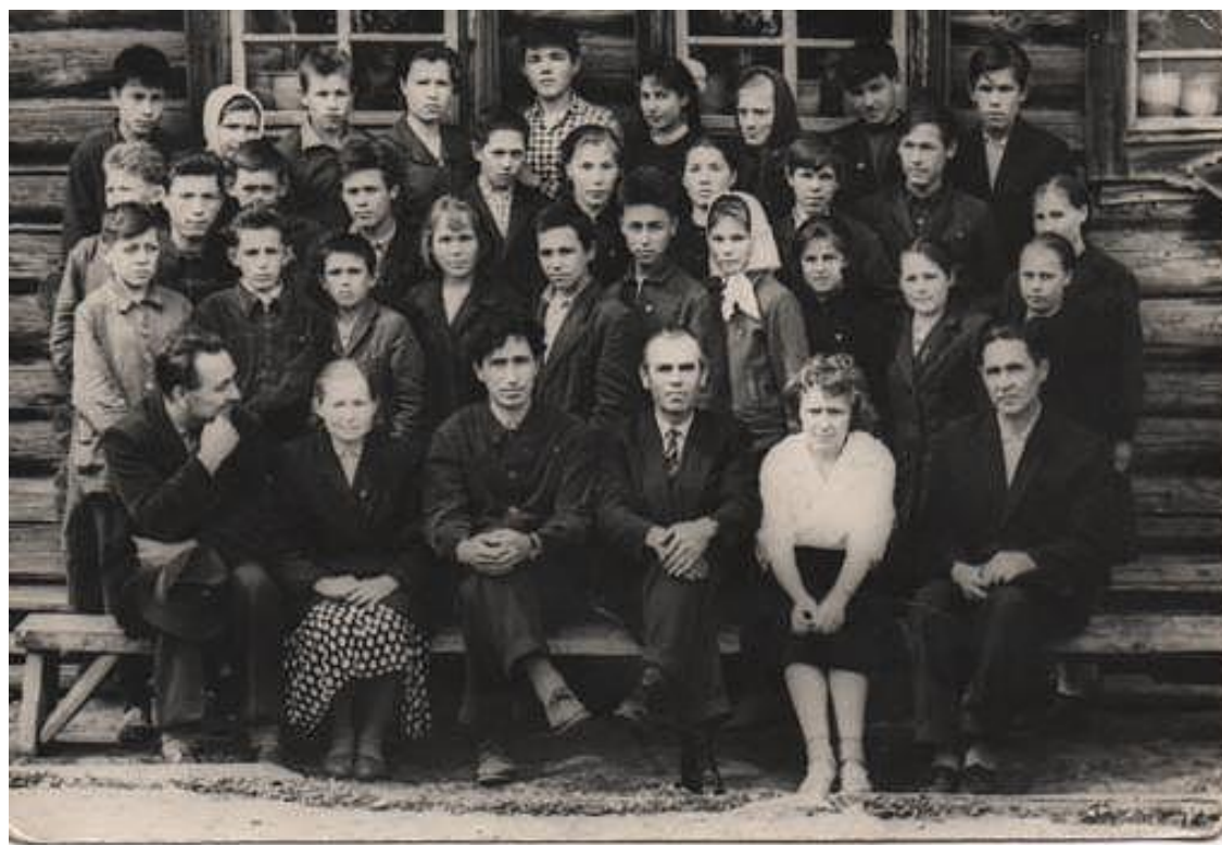
8 класс Больше-Тавринской школы.1964г.