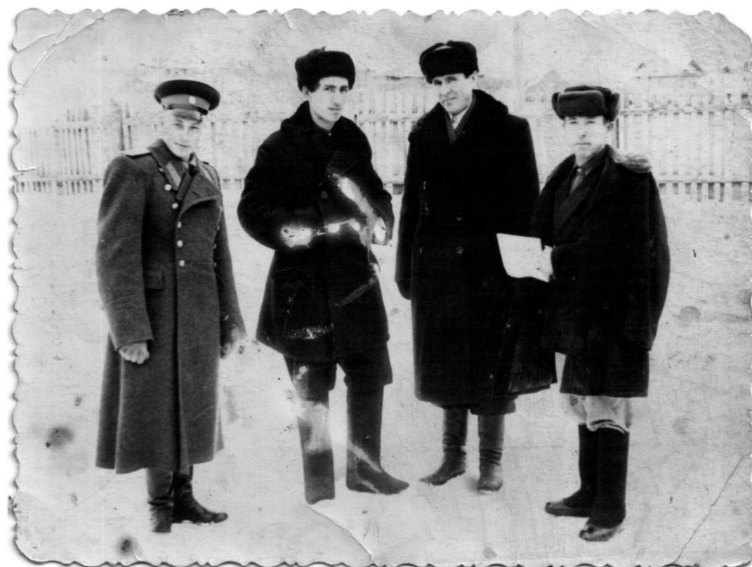
Учителя Больше-Тавринской школы.1950-гг.