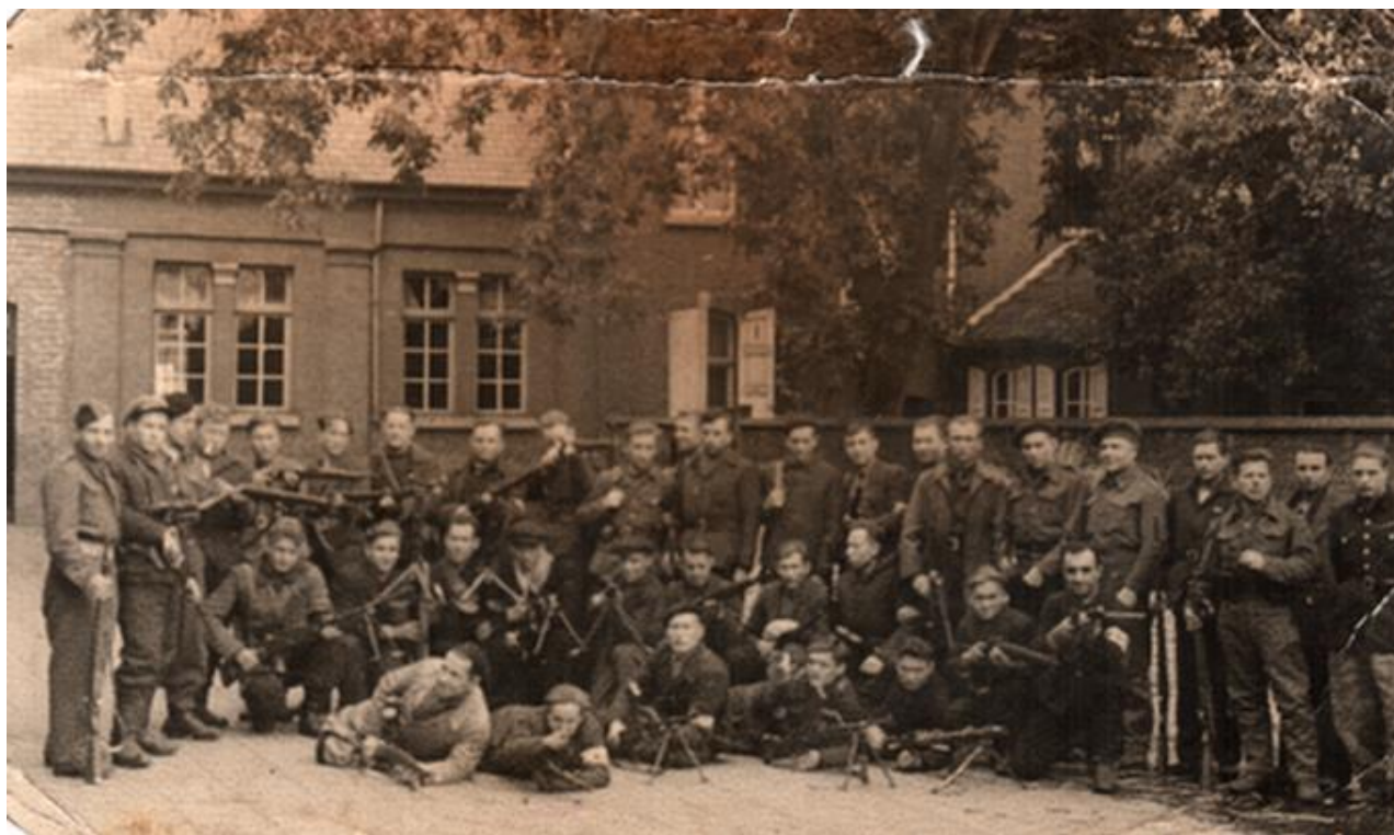
Фотография русского партизанского батальона при бельгийской армии. Бельгия 1944 год. Ф. Р-1. Оп. 1. Д. 19450 Л. 46